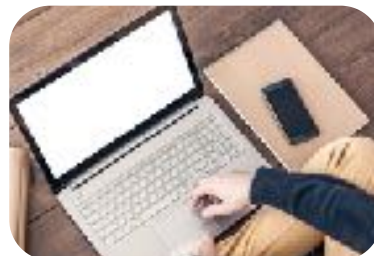
Malé a středně velké firmy, které nemají silné IT