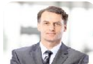
Advokáti, exekutoři, daňoví poradci, auditoři, insolvenční správci, atd.