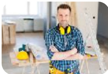
Živnostníci (podnikající fyzická osoba)