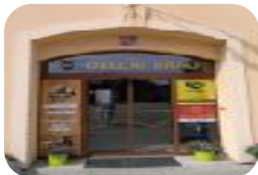
Městské a obecní úřady (i další OVM)